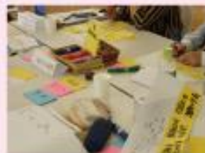
組織の課題を深掘りしながら、課題の根本を変えるワークを行います。